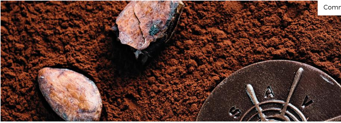
Purement chocolat, sous la monnaie de Paris Selon Guy Savoy