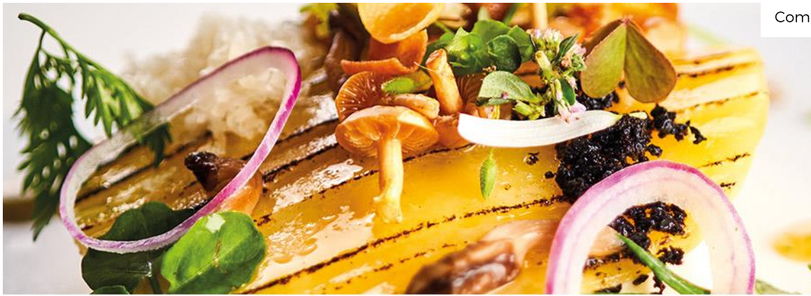
Vaporeux de pommes de terre Selon Serge Vieira